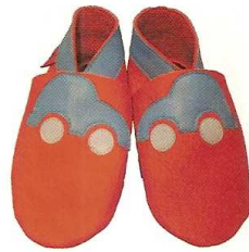
MINI-FORMAT: Die farbenfrohen Finkli sind aus feinem Lammleder.